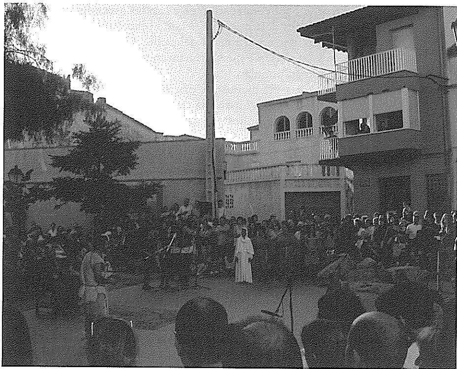
Vista general de la plaça major de Rodonyà durant la representació del Ball Parlat de Sant Joan on es pot apreciar la gran quantitat de gent que s'aplegava a redós de l'espai on tenia lloc l'escena. (I. Pastor i Batalla, 2013).

que va fer un mestre anomenat Rodríguez i que sols es va interpretar una única vegada cap a l'any 1905. 4